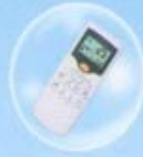
รีโมทไร้สาย ไร้สาย Digital